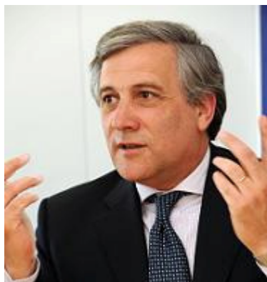
Il Vicepresidente Antonio Tajani